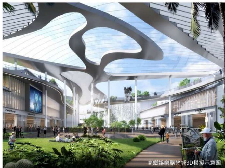
高鐵娛樂購物城3D模擬示意圖